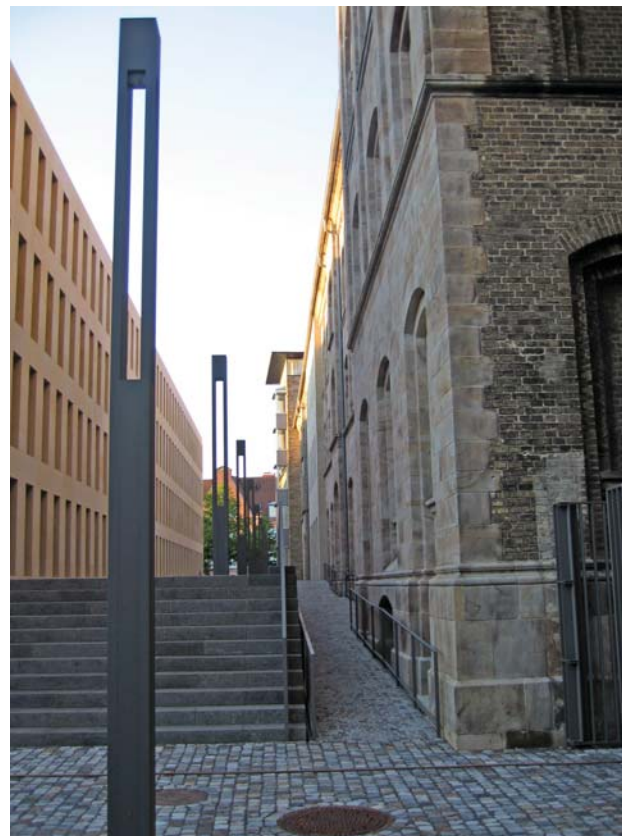
Rampa sobria y discreta. Entorno histórico monumental de Münster (Alemania)