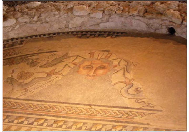
Detalle mosaico, Carranque