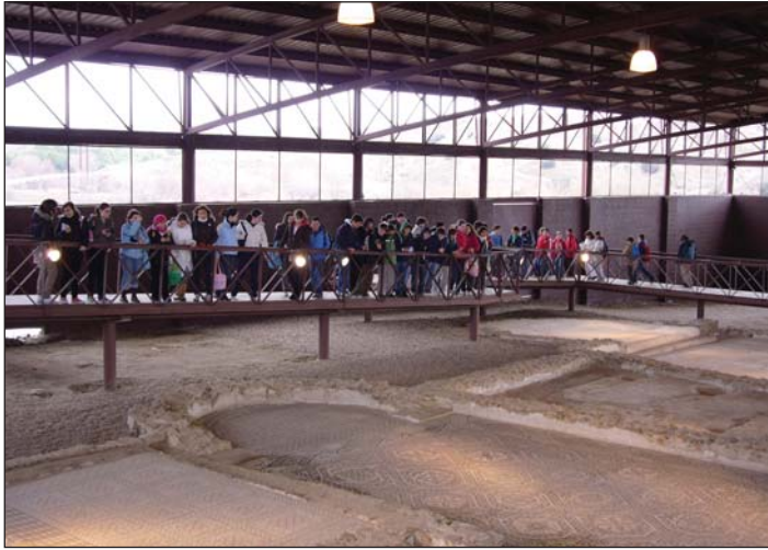
Yacimiento Arqueológico de Carranque, Toledo