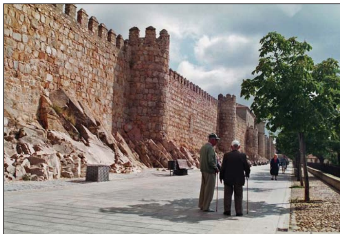
Ávila. Paseo en torno a las murallas

María Zambrano plasmó con maestría el equilibrio y su levedad, y es ese equilibrio otra de las herramientas indispensables para acertar al plantear soluciones que faciliten la accesibilidad del Patrimonio. Pero el equilibrio, por su propia naturaleza, es inestable, de ahí que insista de nuevo en la necesidad de trabajar con discreción y con sentido común en este tema, de modo que no se altere la esencia del pasado ni se cierren las puertas al derecho de conocerlo y disfrutarlo por cada persona.